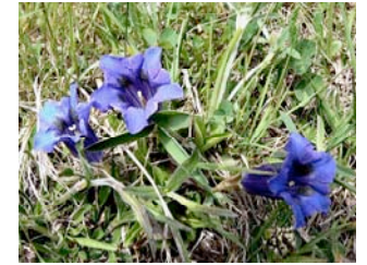
Primavera 2008

La comunità è stata risolta nel 2006-07 per via di divergenze irrisolvibili e per motivi di salute. Si sono formati due piccole aziende autonome delle famiglie Meyer e Mosimann. Il patrimonio in comune è stato ripartito. Oggi le due famiglie tengono in comune solo: La teleferica, i macchinari grandi, la sosta per la