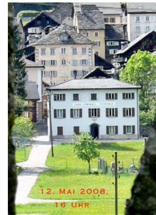
Chironico 12 maggio 2008