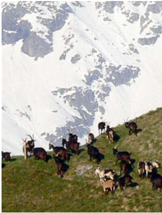
Alla mattina in maggio le capre si dirigono verso Cala