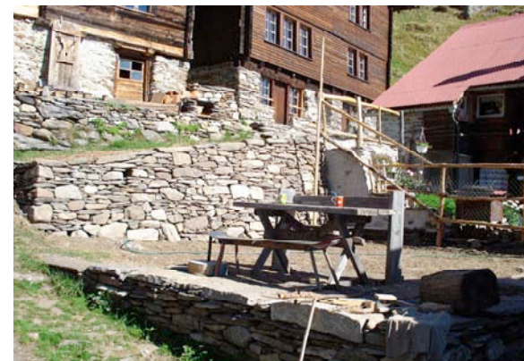
Nuova piazzetta presso il forno

Quest'anno l'inverno è arrivato presto già alla fine di ottobre.