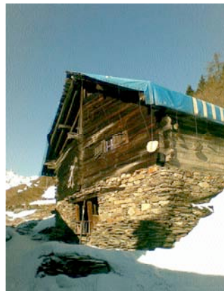
La stalla "Venzinger" dove è previsto il nuovo caseificio con alloggio.