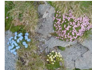
Flora auf dem Pizzo Forno