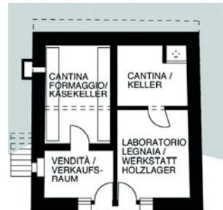
PIANO CANTINA / UG