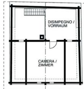
MANSARDATO / DG