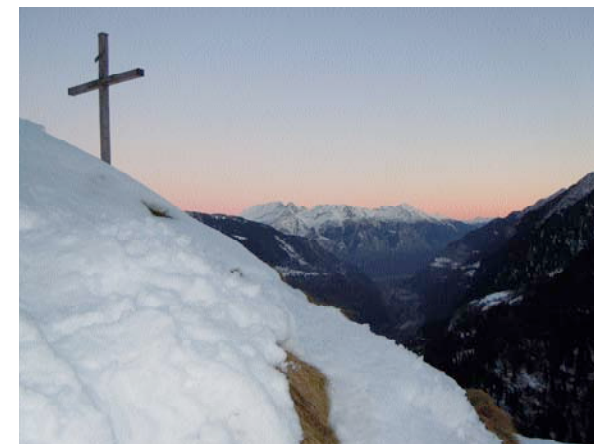
Titelbild: Doro Anfang November 2010.