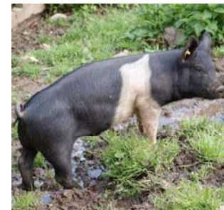
Zur Käseerei gehören auch sie...

4.) Die Übernahme und Verbesserung des Alpstalls, insbesondere die Abdichtung der Wände und des Dachs damit er auch im Winter gebraucht werden kann.