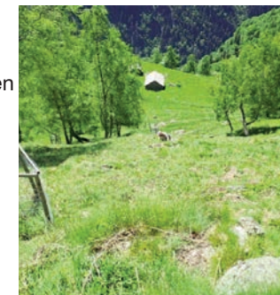
Arbeiten am Steilhang

Zwei Teilflächen wurden von April bis Mitte September von der Beweidung ausgezäunt. Der untere Bereich umfasste dabei rund 400 m 2 , der Bereich neben der Seilbahn etwa 150 m 2 . Mitte September erfolgte die Mahd. Das gewonnene Heu wird den Geissen im Winter als Einstreu dienen. In den ausgezäunten Bereichen war ein deutlich höherer Anteil blühender Stauden zu beobachten als auf den von den Geissen beweideten Flächen. Besonders im Hochsommer, wenn wenig Blüten vorhanden sind, dienen die Flächen als wertvolle Futterquelle für Insekten.