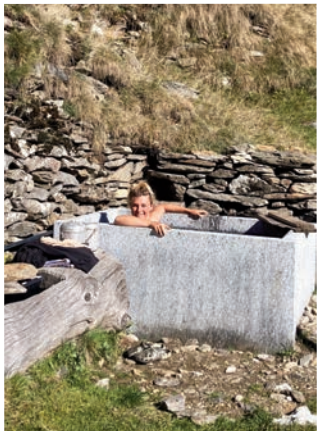
Der neue Trog beim Brunnen

Bald schon neigte sich die Alpsaison ihrem Ende entgegen. Die Geissen von Jamusci und die 4 Schweine sind runter gegangen. Man begann mit den Herbstarbeiten wie Mist verteilen, Holzen und Würste machen. Im Oktober wurden auf dem Weg nach Ces durch die Fondazione Ces, den Leuten von Olina und unserer Mithilfe 2 neue Brücken über den Sumpf gebaut.