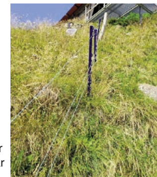
Unterschied: Eingezäunte und nicht eingezäunte Flächen