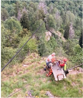
Reparatur Seilbahn im Juli

Männer von der Bergrettung zum Wägeli abseilen und die Kiste mit dem Hund drin bergen. Trotz einer unangenehmen Nacht ging es den Hund gut und er wurde mit dem Heli runtergefliegen. Die nächste grosse Herausforderung war nun, die Seilbahn wieder in Betrieb nehmen zu können, denn in Doro war Hochsaison.